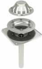
Type No. 402